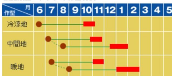
家庭菜園ニンジンの作型目安