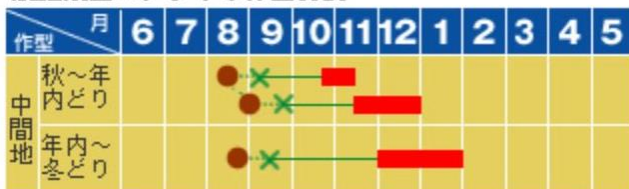
家庭菜園ハクサイの作型目安