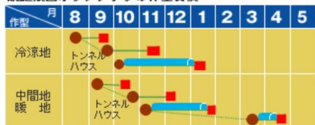
家庭菜園ホウレンソウの作型目安